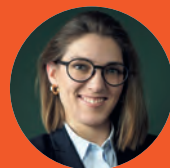
Dr. Franziska Ryser, CH Nationalrätin

«Nachhaltiger Wandel entsteht, wenn wir uns gemeinsam für die Rechte und die Unversehrtheit von Frauen einsetzen.»